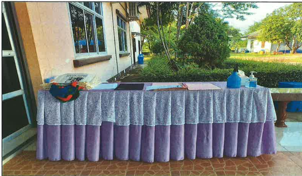
จุดลงทะเบียน ผู้เข้าร่วมอบรมตามโครงการ