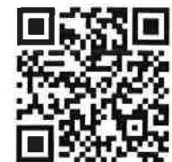
ประกาศฉบับเต็ม