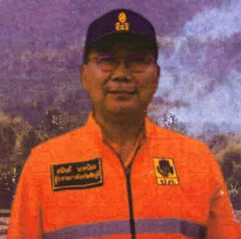
นายอนันต์ นาคนิยม ผู้ว่าราชการจังหวัดชัยภูมิ

อาจทำให้หลายพื้นที่ มีค่าปริมาณฝุ่นละออง ขนาดเล็ก (PM 2.5 ) เพิ่มขึ้น