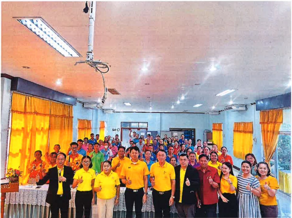
ภาพประกอบโครงการรณรงค์คัดแยกขยะที่ต้นทาง ประจำปี ๒๕๖๗ วันที่ ๕ กันยายน พ.ศ. ๒๕๖๗ ณ ห้องประชุมองค์การบริหารส่วนตำบลละหาน ตำบลละหาน อำเภอจัตุรัส จังหวัดชัยภูมิ