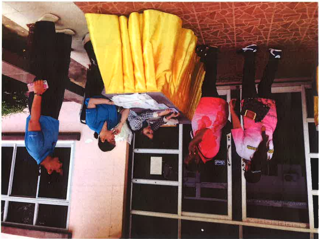
រដ្ឋមន្ត្រីក្រសួងសេដ្ឋកិច្ច និងហិរញ្ញវត្ថុ ក្រសួងសេដ្ឋកិច្ច ក្រសួងសេដ្ឋកិច្ចកម្ពុជា និងមន្ត្រីស្រុកស្រីសោភ័ណ រាជធានីភ្នំពេញ រួម មាន ឯកឧត្តម កែវ កែវស្រី គណៈកម្មាធិការ ៧០២ ក្រសួង ឯកឧត្តម ជ័យ ជ័យស្រី រដ្ឋមន្ត្រីក្រសួងសេដ្ឋកិច្ច និងហិរញ្ញវត្ថុ និងមន្ត្រីស្រុកស្រីសោភ័ណ រាជធានីភ្នំពេញ