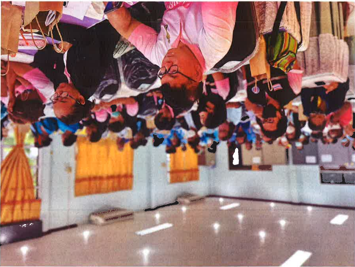
ថ្ងៃទី១៧ ខែសីហា ឆ្នាំ២០២១ ពិធីបើកការងារ ពិធីបើកការងារសម្រាប់សមាជិកសមាជិកនៃគណៈកម្មាធិការ ប្រឹក្សាភិបាល គណៈកម្មាធិការ និង គណៈកម្មាធិការសម្រាប់សមាជិកសមាជិកនៃគណៈកម្មាធិការ ប្រឹក្សាភិបាល គណៈកម្មាធិការ និង គណៈកម្មាធិការសម្រាប់សមាជិកសមាជិកនៃគណៈកម្មាធិការ