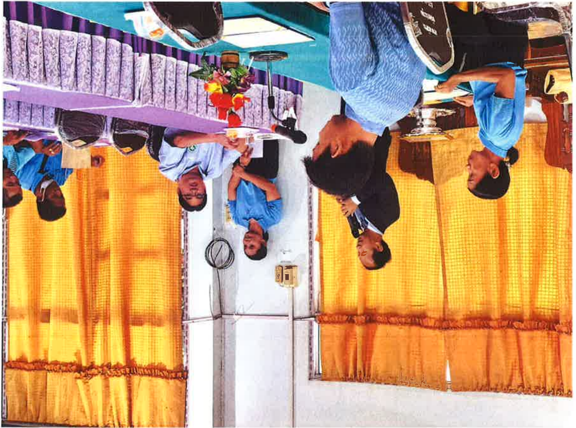
ឧបនាយករដ្ឋមន្ត្រី ឧបនាយករដ្ឋមន្ត្រី ក្រសួងកសិកម្ម រុក្ខាប្រមាញ់ និងនេសាទ រដ្ឋមន្ត្រីក្រសួងកសិកម្ម រុក្ខាប្រមាញ់ និងនេសាទ ឧបនាយករដ្ឋមន្ត្រី ក្រសួងកសិកម្ម រុក្ខាប្រមាញ់ និងនេសាទ រដ្ឋមន្ត្រីក្រសួងកសិកម្ម រុក្ខាប្រមាញ់ និងនេសាទ