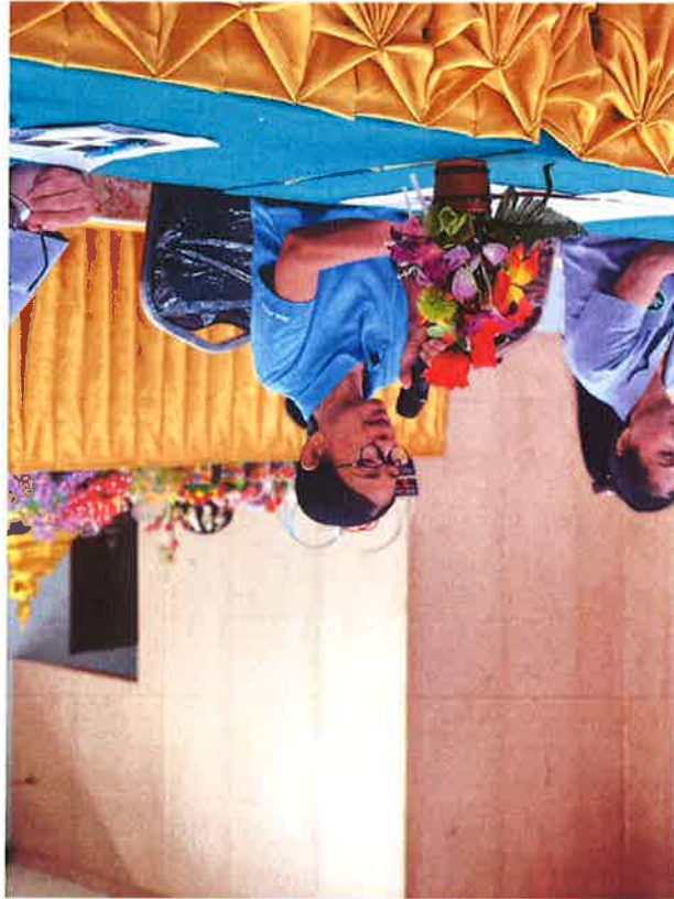
ប្រធានក្រុមការងារ មន្ត្រីស្រុកស្រែចម្រុះ ក្រសួងកសិកម្ម រុក្ខាប្រមាញ់ និងនេសាទ ឧបនាយករដ្ឋមន្ត្រី លោកជំទាវ ហ៊ុន ម៉ាណែត ឧបនាយករដ្ឋមន្ត្រី លោកជំទាវ ហ៊ុន ម៉ាណែត ក្នុងពិធីបើកការងារប្រចាំឆ្នាំ ២០២២ នៃក្រុមការងារ មន្ត្រីស្រុកស្រែចម្រុះ ក្រសួងកសិកម្ម រុក្ខាប្រមាញ់ និងនេសាទ