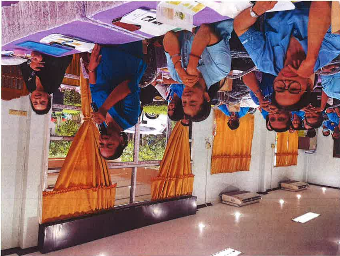
ថ្ងៃទី៣១ ខែសីហា ឆ្នាំ២០២៣ ក្នុងក្រុងភ្នំពេញ ក្រសួងសុខាភិបាល ក្រសួងសេដ្ឋកិច្ច ហិរញ្ញវត្ថុ និង ពាណិជ្ជកម្ម ជំរឿនពាណិជ្ជកម្ម លេខ ០១ រ៉ាប៊ីត ក្រសួងសុខាភិបាល ក្រសួងសេដ្ឋកិច្ច ហិរញ្ញវត្ថុ និងពាណិជ្ជកម្ម ក្រសួងស្ថិតិ និងព័ត៌មានជាតិ ក្រសួងស្ថិតិ និងព័ត៌មានជាតិ