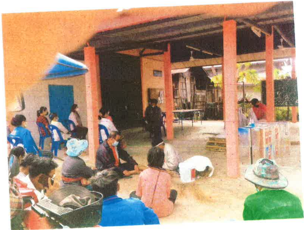
អភិបាល លេខ១០២៤