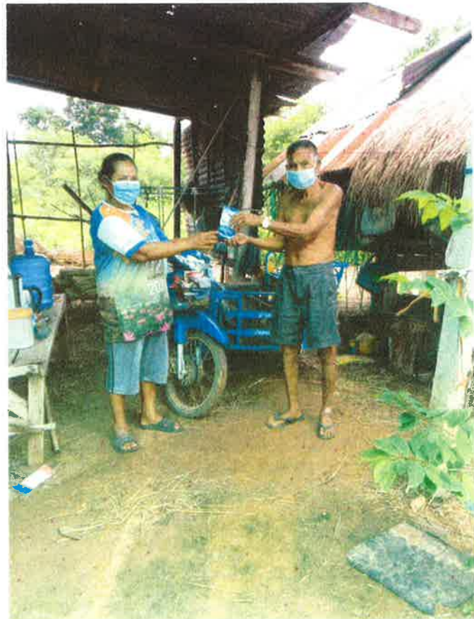
ភ័យខ្លាច ១៣/១០/២០