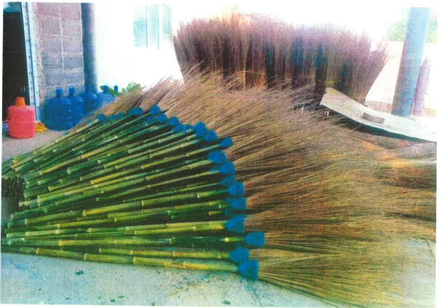
ภาพกิจกรรม สักนโขน๒๓ ม. 12