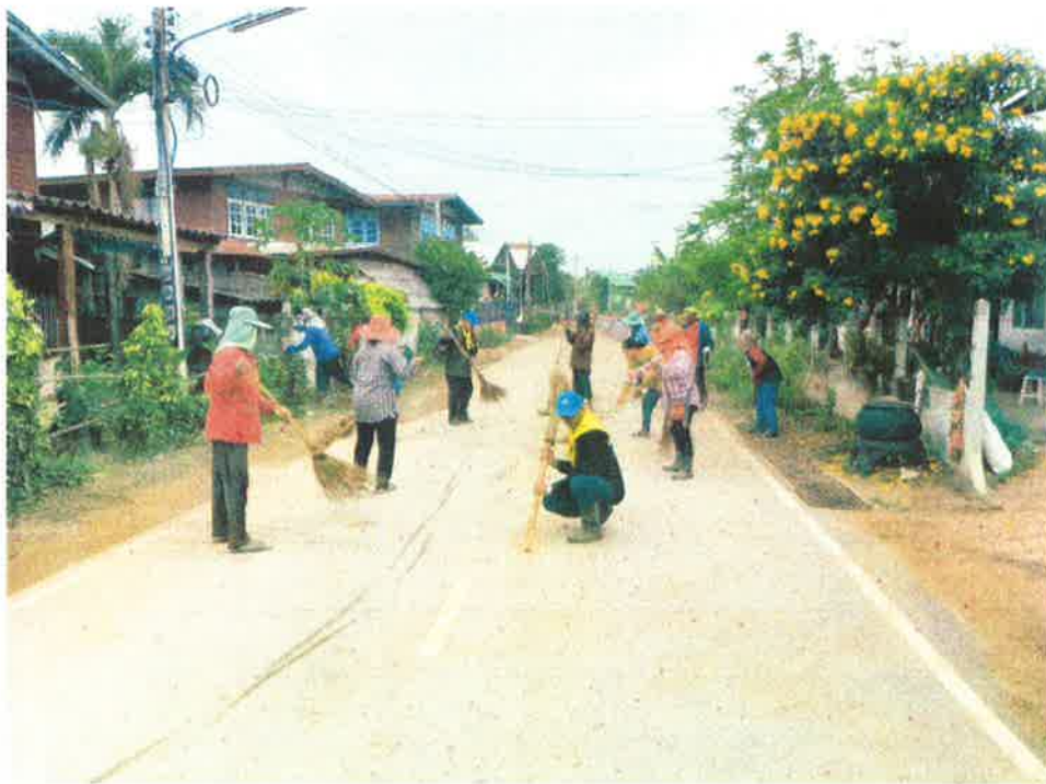
សម្រាប់ស្ថានភាព សាងសង់ស្រះ បង្កើន