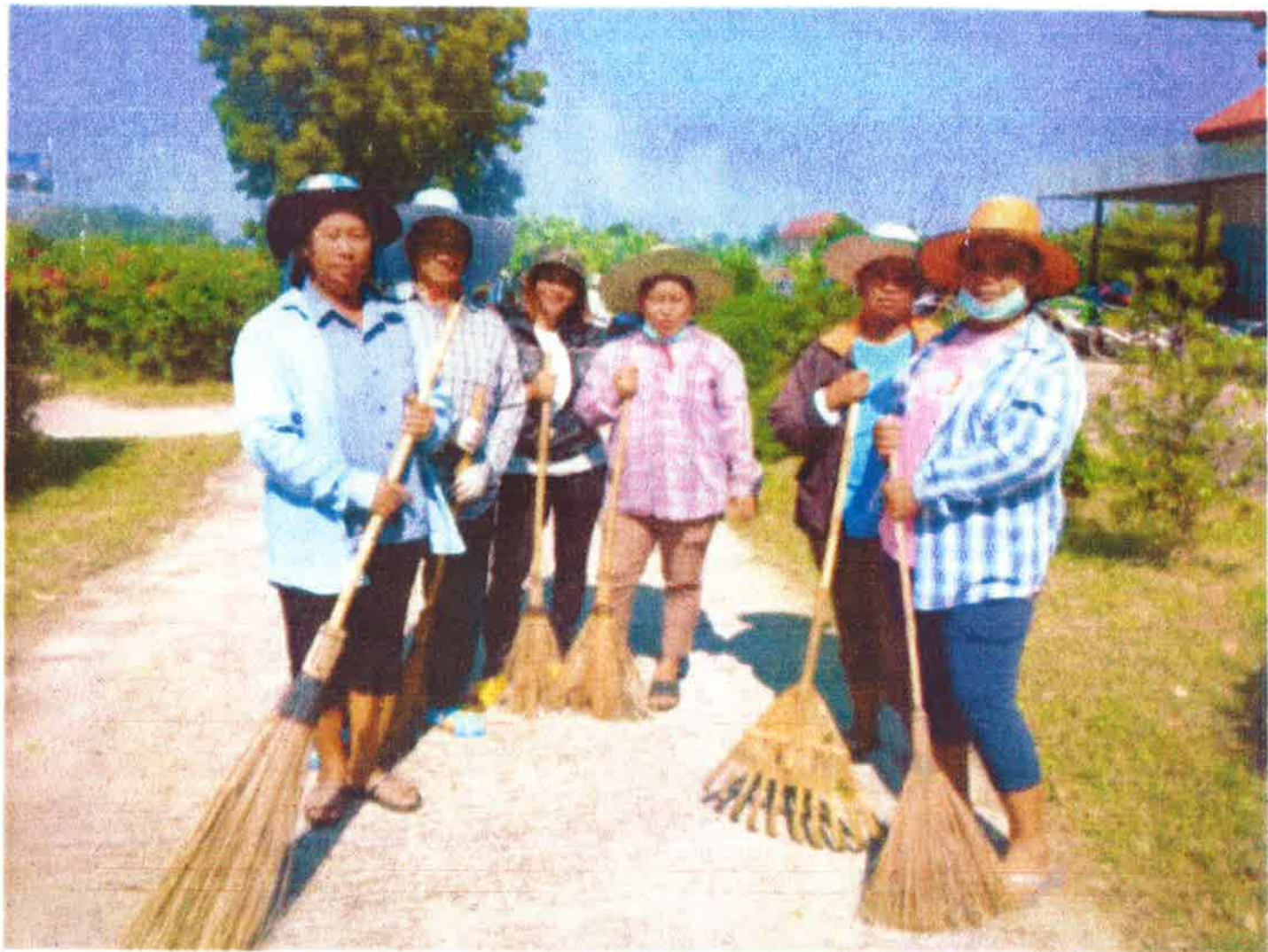
ภาพกิจกรรม สานฝัน ๒๗ ๕. ๑๒