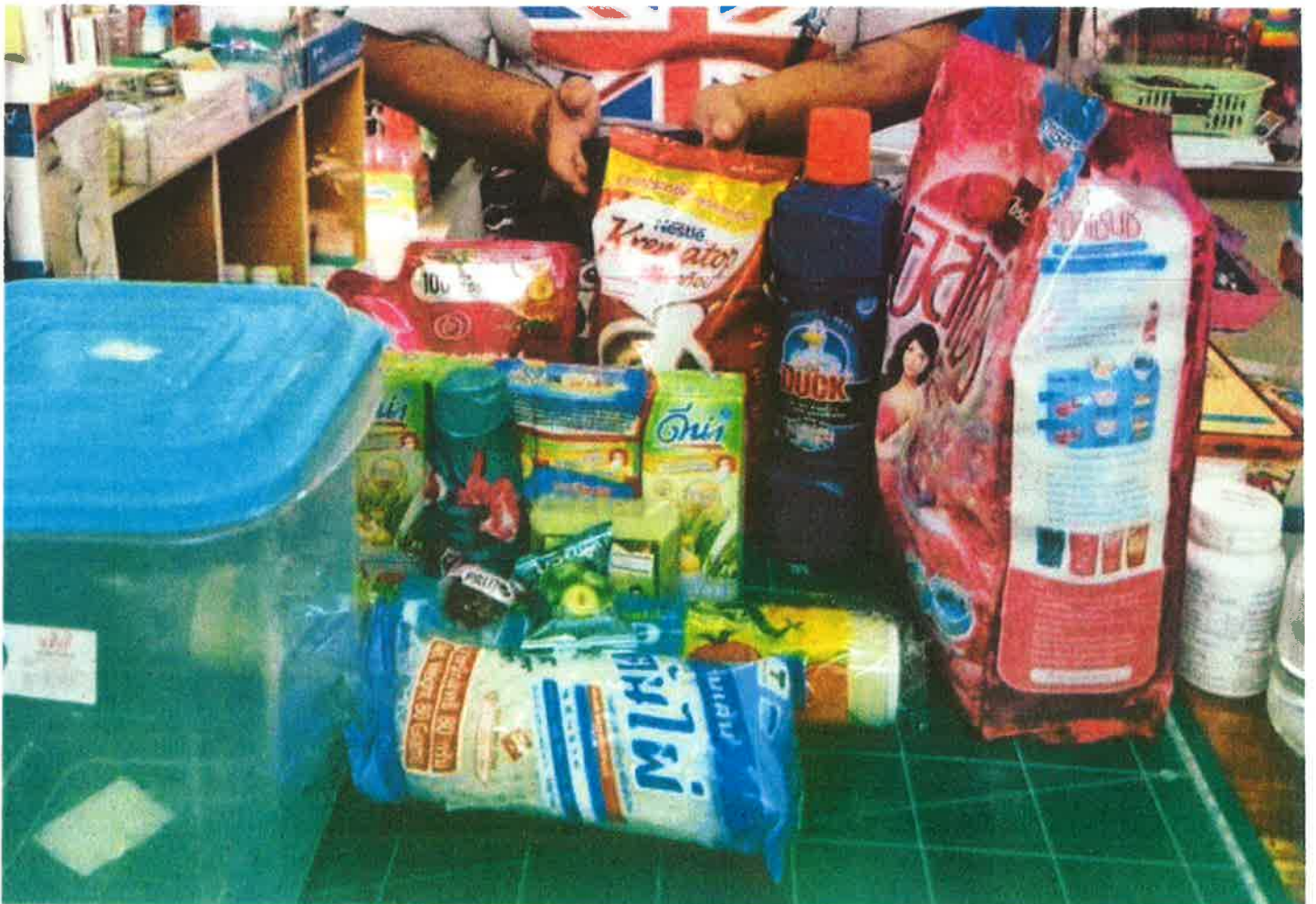
ภาพกิจกรรม หน้าที่ที่ 12