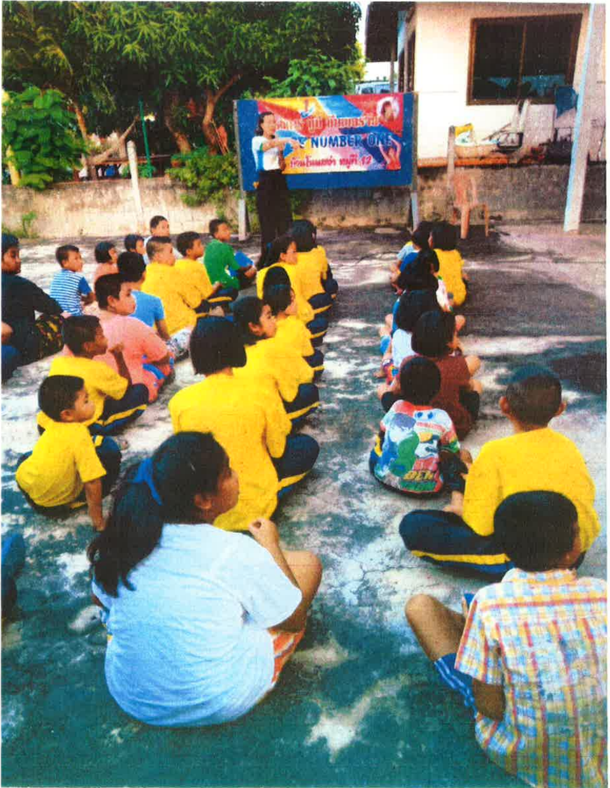
ภาพกิจกรรม - ฝึกเขียนเลข ๑ ๒