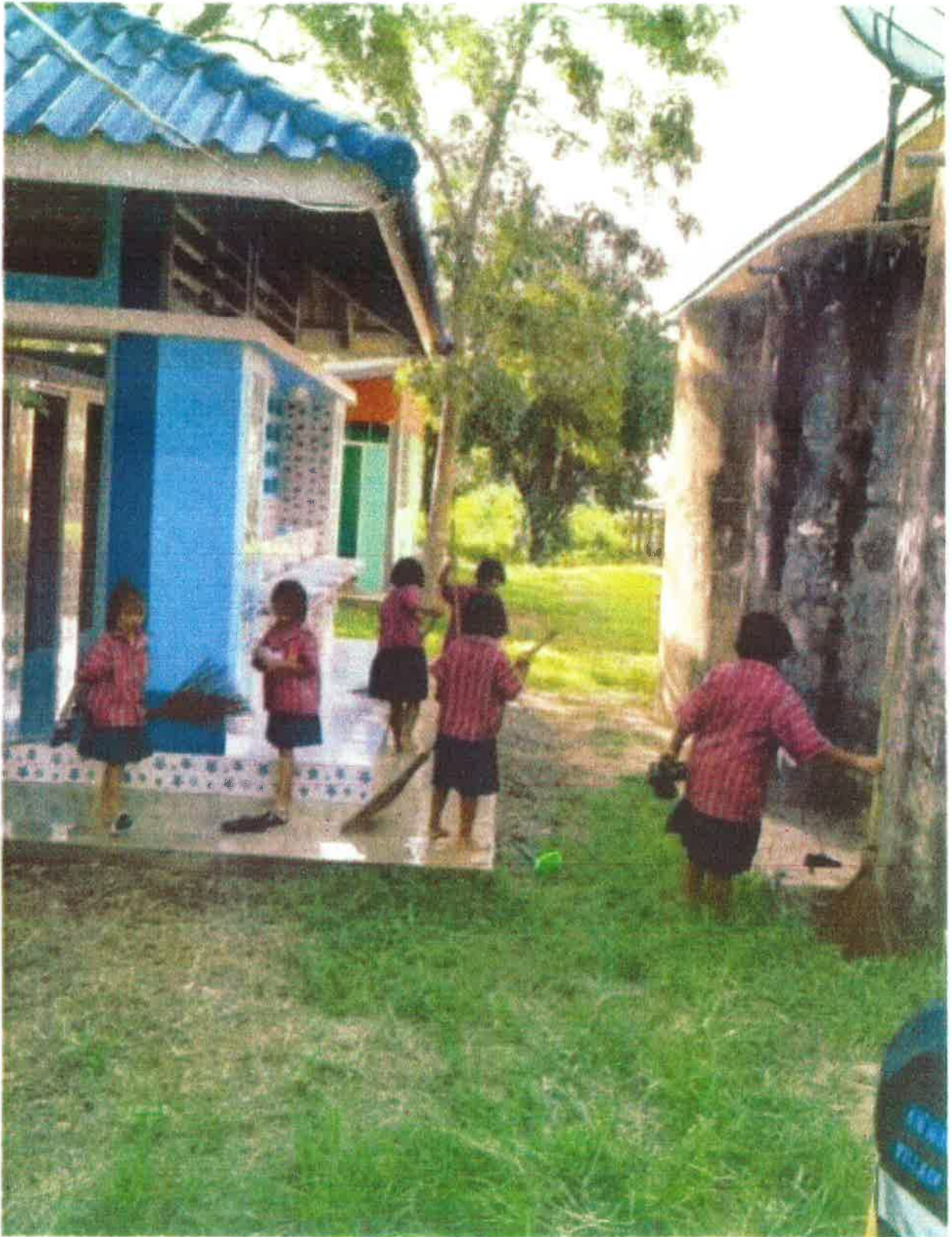
การทำความสะอาด บริเวณโรงเรียน น. 12